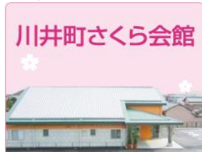
川井町さくら会館