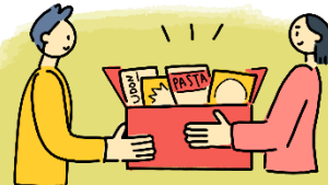
支援を必要としている方へ提供します