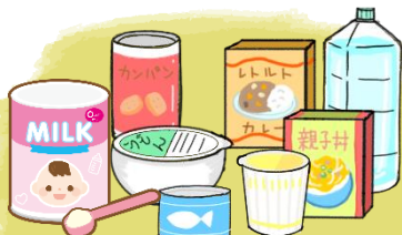
ご家庭で余った商品を

ご家庭で余っている食品を施設までお持ちいただき、寄付をしていただきます。集まった食品は賞味期限等を管理し、支援が必要な方へ桑名市社会福祉協議会より提供します。