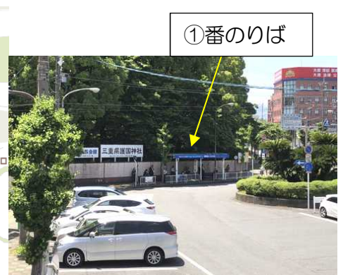
津駅西口からの風景