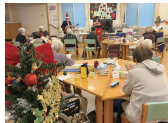
デイサービス松阪 クリスマス会