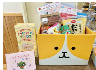
タノモットのハッピーボックス