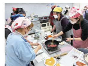
生協キッチン「キンパづくり」