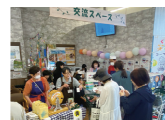
みやがわ店一周年記念祭