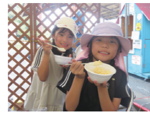
産地交流「四酪フェスタ」