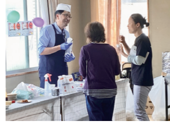
神島での試食交流会