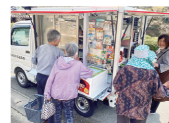
移動販売のようす