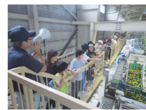
産地交流「南紀みかん」