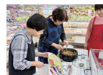
まつさか店周年祭