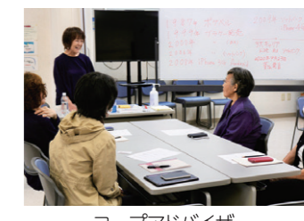
コープアドバイザー スマホでひろがる! 安心&楽しい使い方講座