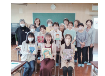
エリアコーディネーター 大人が楽しむ絵本の時間