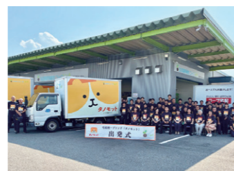
「タノモット」出発式