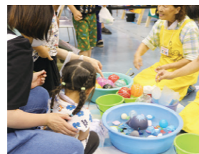
わくわくキッズフェスタ