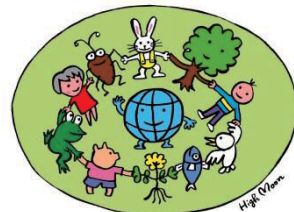
ハイムーン工房ホームページより

アースアワーは、世界自然保護基金（WWF）によって行われている国際的な取り組みです。世界中の人たちが「地球温暖化を止めたい」「地球の環境を守りたい」という思いから、同じ日の同じ時刻に電気を消して過ごします。20：30を迎えた地域から順次消灯を行い、消灯リレーが地球をぐるりと1周します。この日に実施できない方も、この機会に、1年間の振り返りやこの先の事について考えたり話し合ったりしてみませんか。