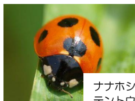
ナナホシテントウ